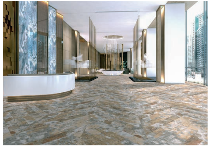
Flotex statement mandala baccarat