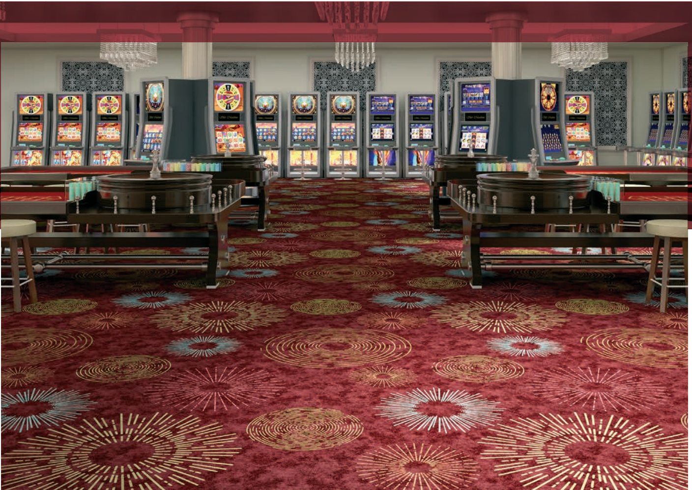
Flotex statement bellagio red roulette