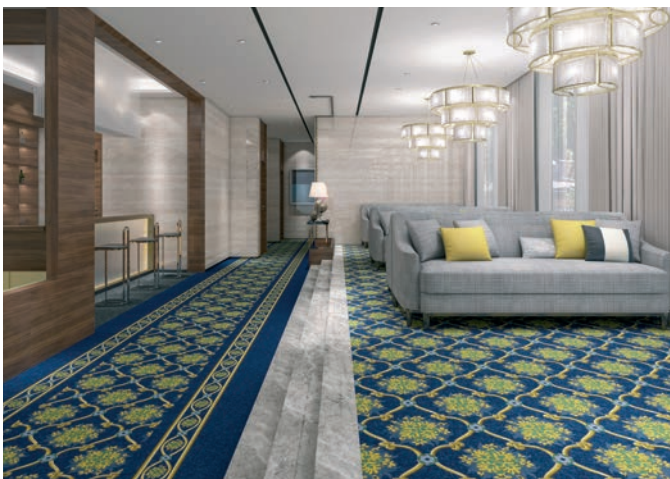
Flotex statement red rock black jack